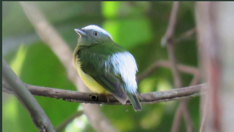
(uirapuru-de-chapel-branco) (♂) Snow-capped Manakin, Lepidothrix nattereri (8cm)