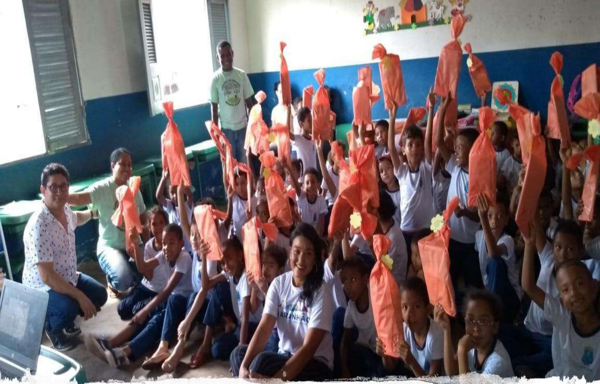
São Luís: Escola Raimundo Chaves