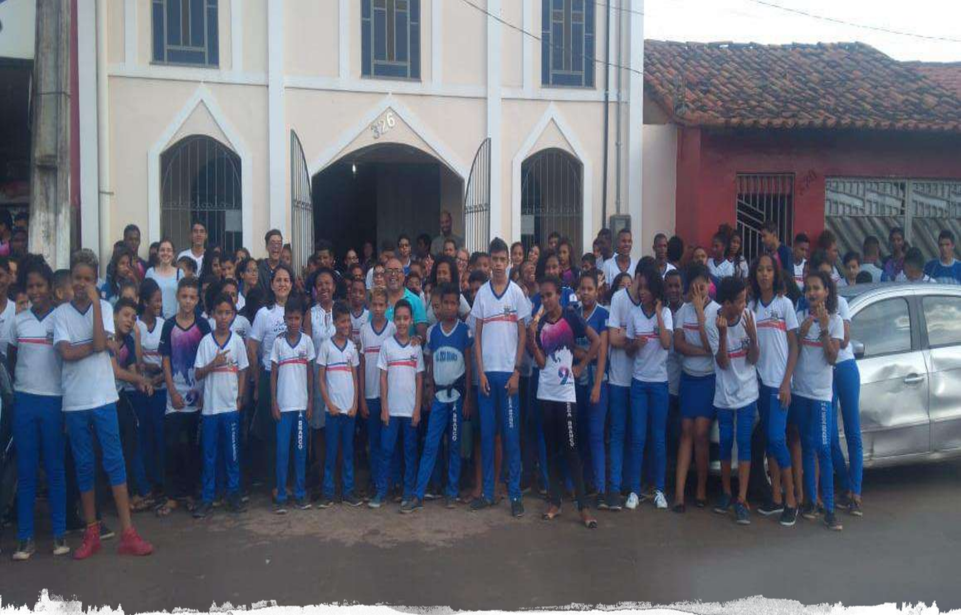
Pedreiras: Escola Estadual Olindina Nunes Freire